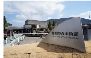
箱根彫刻の森美術館