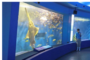
京急油壺マリンパーク