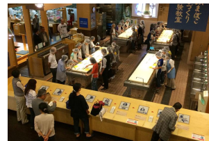
鈴廣かまぼこの里 (かまぼこ・ちくわ手作り体験教室)