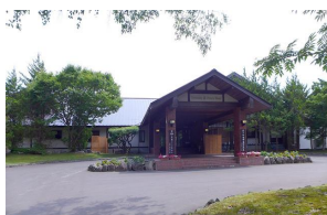
十和田プリンスホテル

【泊まる】「十和田プリンスホテル」(秋田県)、「裏磐梯レイクリゾート 五色の森」(福島県)、「アイランドホテル&リゾート那須」(栃木県)、「星野リゾート 界 アンジン」(静岡県)、「青野運動公苑 アオノスポーツホテル」(兵庫県) 計5施設