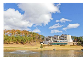
アイランドホテル&リゾート那須