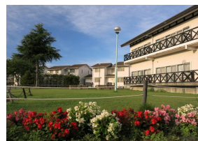
青野運動公苑 アオノスポーツホテル