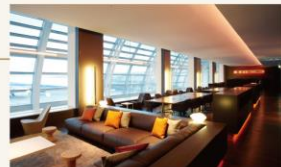
羽田空港第2ターミナル エアポートラウンジ

羽田空港、成田国際空港をはじめとする国内主要空港とダニエル・K・イノウエ国際空港（ハワイ）、仁川国際空港（韓国）のラウンジを無料でご利用いただけます。