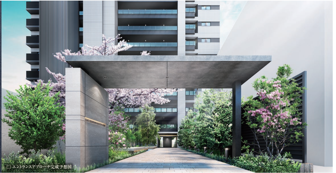
□ エントランスアプローチ完成予想図