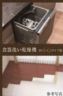
食器洗い乾燥機 ※C1・C2タイプ取付