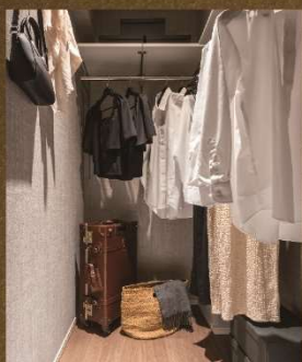
全戸にウォークインクローゼット

D type 3LDK+2WIC+SIC+FM 専有面積: 72.92㎡ バルコニー面積: 10.70㎡ 面積: 83.62㎡ サービスバルコニー面積: 1.93㎡