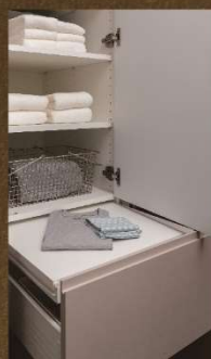
テーブル付リネン庫 ※A・D・G・H・Iタイプ