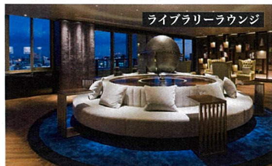
ライブラリーラウンジ

<物件概要>■所在/品川区上大崎3-1-30■権利/所有権■土地面積/5,536.63㎡(敷地権割合:832/1,000,000)■用途地域/第一種住居地域■一棟の総戸数/416戸 ■構造/鉄骨鉄筋コンクリート造■鉄骨造陸屋根地下2階付38階建8階部分■建築年月/2017年7月■管理形態/全部委託■管理員/日勤■管理費/月額10,390円■修繕積立金/月額6,010円■現況/賃貸中■備考/※普通賃貸借契約*その他費用:町会費月額100円*トランクルーム面積:0.38㎡(0.11坪)専有面積に含まず■引渡/相談■取引態様/媒介(BF)