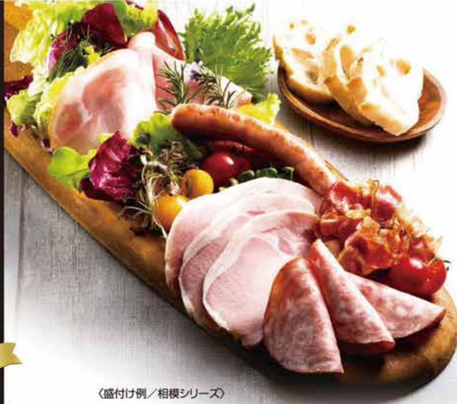
〈盛付け例／相模シリーズ〉